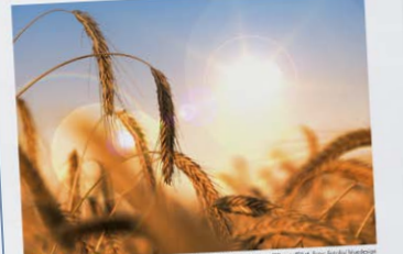
Stets natürlich aus, wie es der Welt. Trockenheit und Hitze haben zu großen Ernteverlusten geführt.